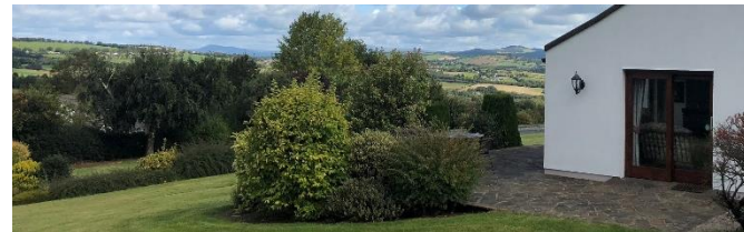
Blick über die Terrasse von Haus Miriam ins weite Tal