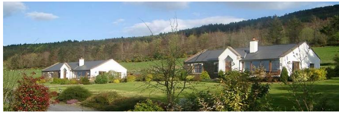
Mount-Leinster-Cottages, Haus Klara 104 m 2 , li., Haus Miriam 85 m 2 , re.