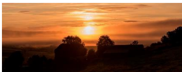
Blick aus dem Schlafzimmerfenster von Haus Klara: Sonnenaufgang