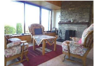
Wohnraum, offener Kamin