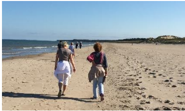
Ein breiter feiner Sandstrand an der Irischen See (Kilmuckridge) ist nur ca.45 km von Kildavin entfernt