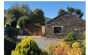
Auffahrt zu beiden Cottages und Parkplatz für 5 PKW